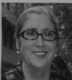
GRAÇA MORAIS Lux 18

É um dos nomes mais importantes da pintura portuguesa da actualidade. Pintora humanista, as mulheres são o objecto privilegiado das suas obras. Já fez inúmeras exposições em Portugal e no estrangeiro.