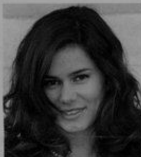
CLÁUDIA VIEIRA Lux 34

Deu os primeiros passos como actriz na série "Morangos com Açúcar" e logo se destacou pelos seus dotes físicos. Jovem, bonita e conhecida do público, é uma das "namoradinhas" de Portugal, aliando a simpatia à beleza.