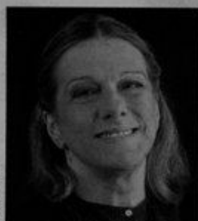
HÉLIA CORREIA Lux 15

Poetisa, dramaturga e ficcionista, revelou-se um dos grandes nomes da literatura portuguesa na década de 80. É autora de peças de teatro e em 2006 venceu o Prémio Máxima de Literatura.