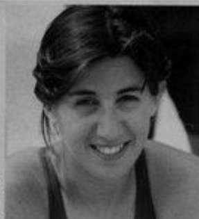
VANESSA FERNANDES Lux 22

É a campeã da Europa de triatlo e é líder no ranking mundial da modalidade. Em 2006 conquistou a 12ª vitória consecutiva em provas da Taça do Mundo. A grande aposta para os Jogos Olímpicos de 2008, em Pequim.