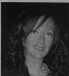
ANA SALAZAR Lux 21

Organizou os primeiros desfiles em Portugal nos anos 70. Em 1985, foi a primeira a abrir uma loja em Paris. Tem criações tão distintas como perfumes e cerâmica. É das mais prestigiadas estilistas nacionais.