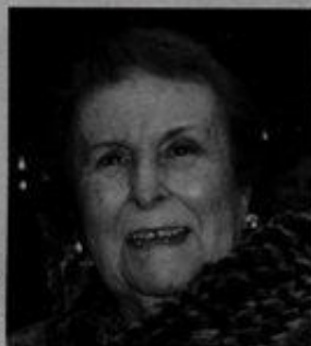
AGUSTINA BESSA-LUÍS Lux 13

Nome incontornável da literatura portuguesa, mantém-se uma rebelde de pensamento. Contista, dramaturga, cronista, romancista. A sua obra tem sido alvo de estudos e de adaptações para televisão e cinema.