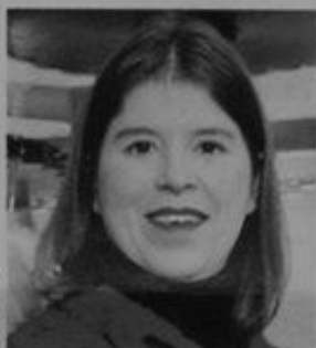
JOANA VASCONCELOS Lux 17

É a jovem artista plástica mais marcante dos últimos anos. Com uma criatividade sui generis , usou 14 mil tampões para fazer um lustre a que chamou "A Noiva". Expõe regularmente em Portugal e no estrangeiro.