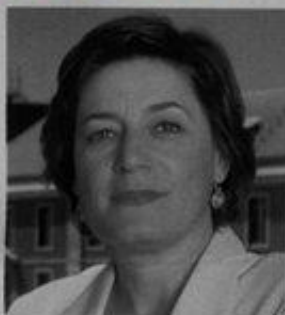
ANA GOMES Lux 25

Foi uma das caras mais visíveis na luta pela defesa dos direitos humanos em Timor. Eurodeputada pelo PS desde 2004, protagonizou, em 2006, uma luta com o Governo português por causa dos voos secretos da CIA.