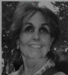
PAULA REGO Lux 16

Pintora portuguesa das mais conceituadas internacionalmente, é já uma referência do século XX. Em 2006, expôs em Serralves e foi a autora do retrato oficial do então Presidente da República, Jorge Sampaio.