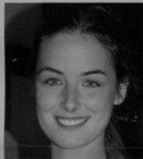
HELENA COELHO Lux 36

Em 2006, foi eleita a Mulher Mais Sexy de Portugal. A repórter do programa "Só Visto!" chama a atenção graças aos olhos azuis e às medidas perfeitas do seu corpo. É uma das caras mais bonitas da televisão portuguesa.