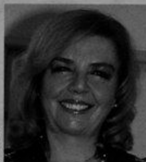
RITA FERRO Lux 14

É uma das escritoras com maior visibilidade, cujos romances apresentam uma escrita simples e histórias com as quais toda a gente se identifica. Romancista e cronista, escreve com regularidade na imprensa.