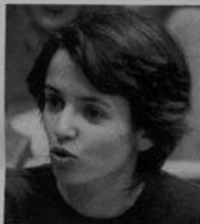
ANA DRAGO Lux 27

A deputada do Bloco de Esquerda destaca-se nos debates da Assembleia da República pela pertinência das suas ideias e pela capacidade de argumentação. É um dos nomes em ascensão da nova geração de políticos.