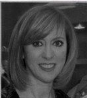
JUDITE SOUSA Lux 11

Com 25 anos de carreira, tem uma forte imagem de credibilidade junto do público, graças a uma atitude séria e acutilante. Coordena "Notas Soltas" e "Grande Entrevista", na RTP, onde começou com 18 anos.